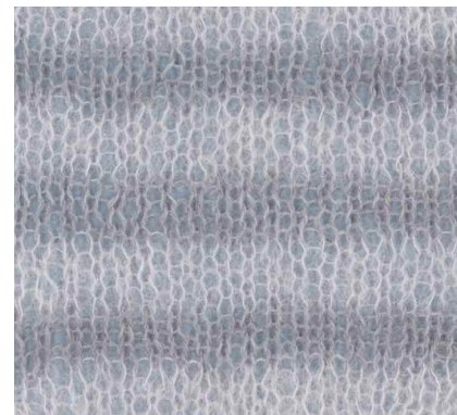
4. Grå toner